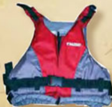
▼ Schwimmweste Nautiraid