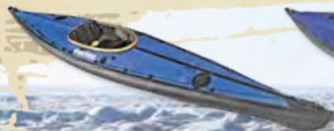
RAID I 460