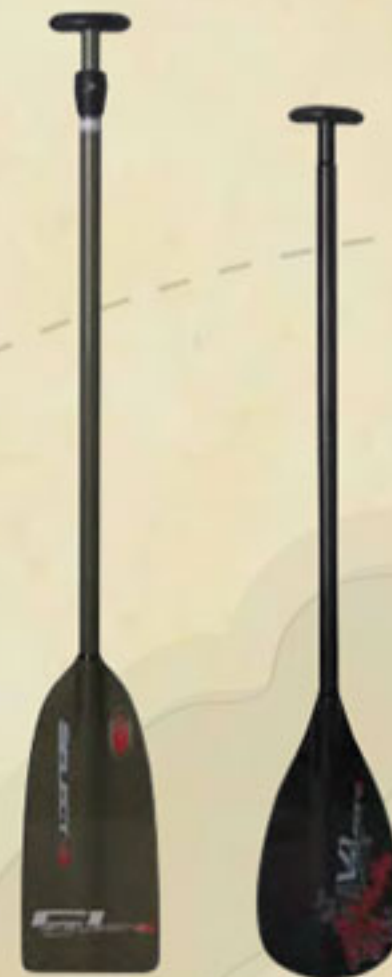
▲ SELECT aus Carbon 480 g. V1 Stechpaddel V1 Outrigger