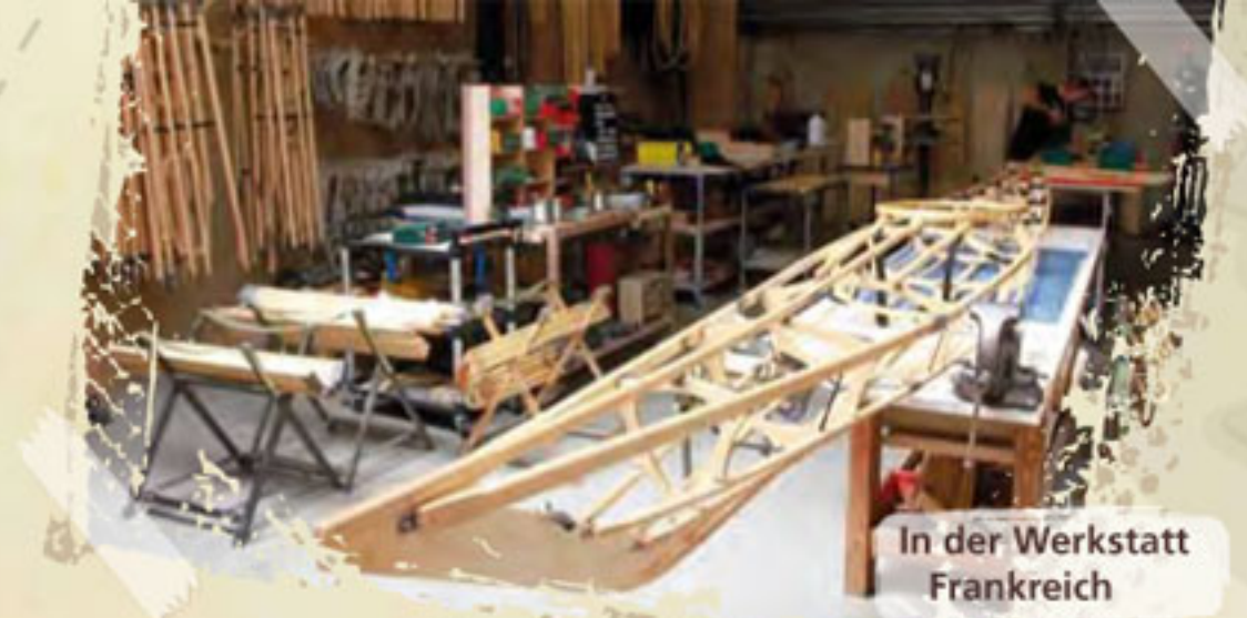
In der Werkstatt Frankreich

Alle Reibestellen an Gerüst und Innenhaut sind durch zusätzliche Polyesterauflagen verstärkt. Die Nähte sind verstärkt und absolut wasserdicht.