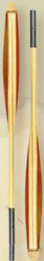
▲ Eskimo (2 Teile) 2,50 oder 2,70 m 1 470 g.