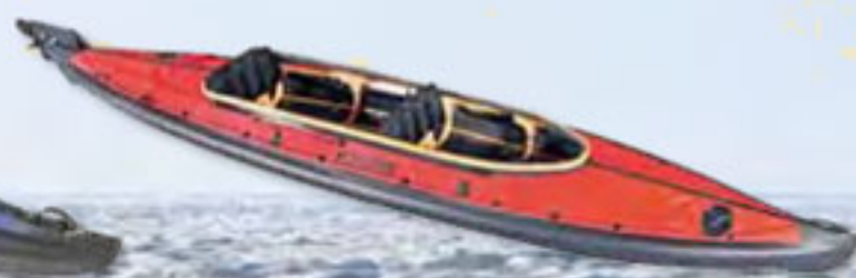
GRAND RAID II 500 UND 540