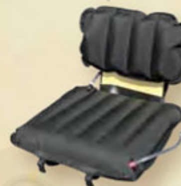
▲ Expedition Sitz