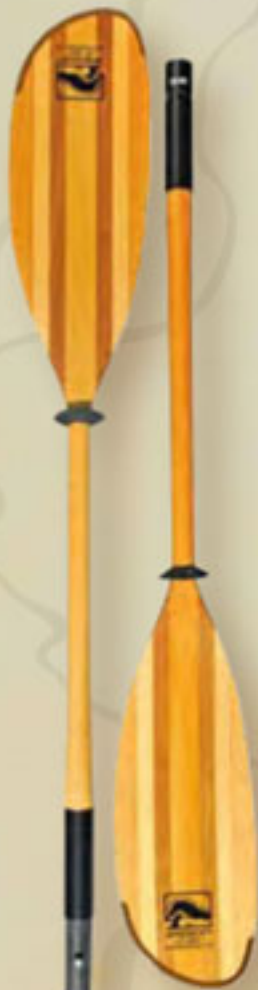
▲ Teilbares Touring (2 Teile) 2,20-2,30- 2,40 / 1 150 g.