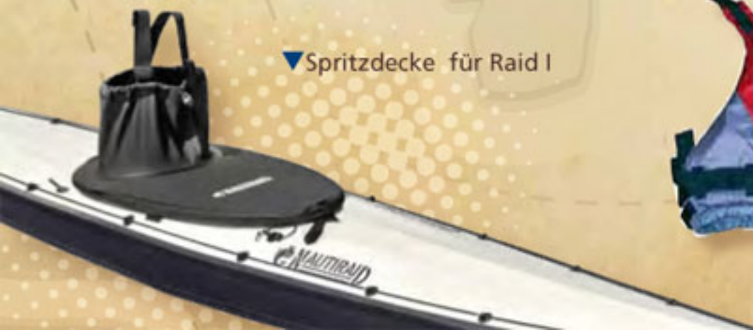
▼ Spritzdecke für Raid I