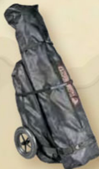
▲ Komfort-Packtasche mit Rädern -1 Tasche für Raid I Alu und Gr.Raid II 500 Alu. 2 Taschen für Raid I Holz und Gr. Raid II Holz