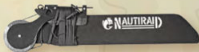
▲ Steueranlage nur Raid I und Raid II