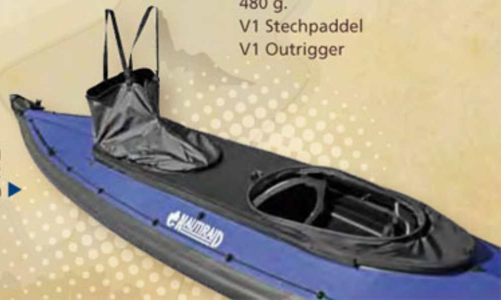
Persenning mit 2 Spritzdecken ▶