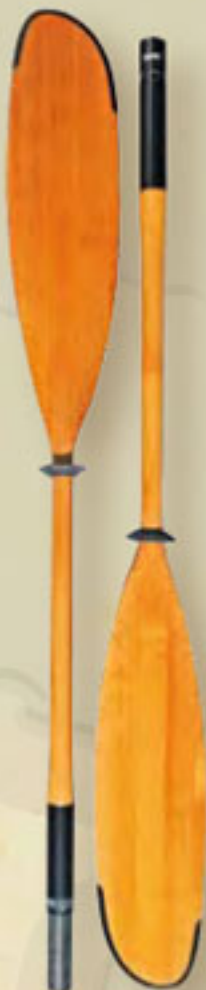
▲ Teilbares Plume (2 Teile) 2,20-2,40 m 1 100 g.