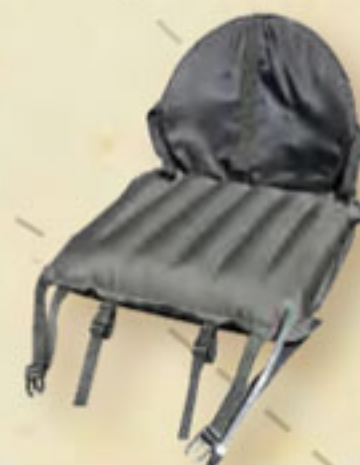
▲ Touring Sitz