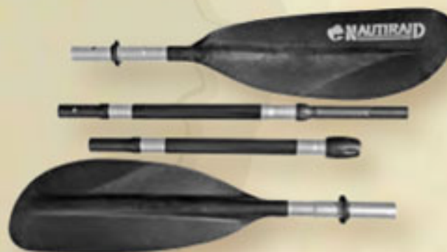
▲ Nautiraid alu 4 teile