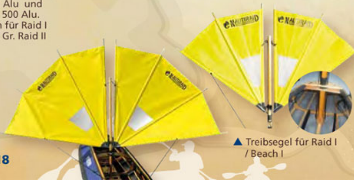
▲ Treibsegel für Raid I / Beach I