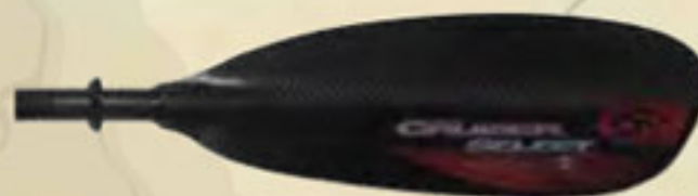
▲ SELECT aus Carbon (2 Teile -720 g. bis 4 Teile 900g.) ovalisierter Schaft oder ergo. Schaft